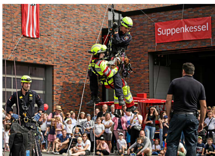
Die Feuerwehr Essen lädt zum Tag der offenen Tür am 25. August. (Archivfoto)